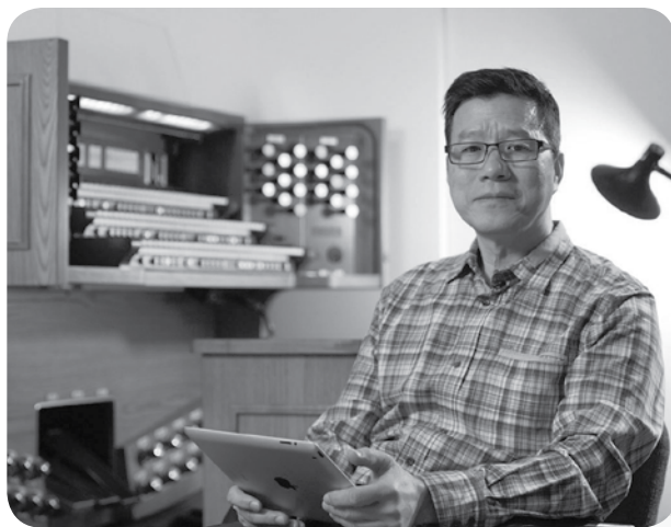
（作者為城北堂副牧師，今年6月至9月休假，致力發展媒體網絡的敬拜訓練事工。）

「這些事都已聽見了，總意就是：敬畏神，謹守他的誡命，這是人所當盡的本分。因為人所做的事，連一切隱藏的事，無論是善是惡，神都必審問。」（傳12:13-14） 家