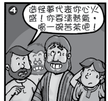
約瑟的父親—雅各也曾在夢中得到啓示，記載在哪裡呢？（創28）