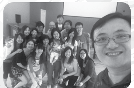
（作者〔右下角〕為城北粵語堂牧師，與年青一族Kairos團契夏令會籌委會自拍照。）

http://guardianlv.com/2013/08/facebook-causes-depression-new-study-says/