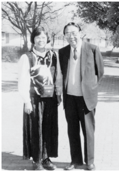
*作者（左）與高牧師攝於南非