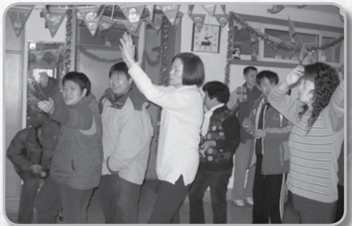
作者和老師們帶領智障的青年人唱歌、跳舞和樂器表演，大家全情投入，十分開心。

智障的青年人用最單純的信心，從心裡唱出最觸動人心靈的歌曲。我知道在世人眼中，他們可能被誤認為沒有價值、被人輕視；但是在神的眼中，他們都是可愛的寶貝兒。