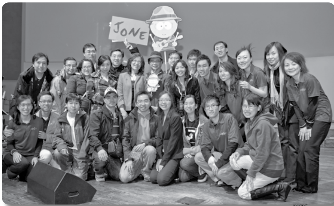
作者接受左腦抽組織檢查（biopsy）手術後，4月25日在The Channels 樂隊35周年慶祝中作見證；會後與愛正堂但以理團契、敬拜組成員及同工們合照。