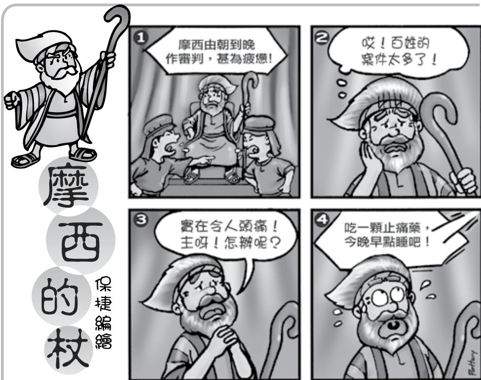
工作與事奉感到疲憊嗎？怎麼辦呢？(詩篇46：10)