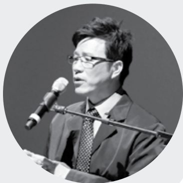
(作者為城北堂牧師)