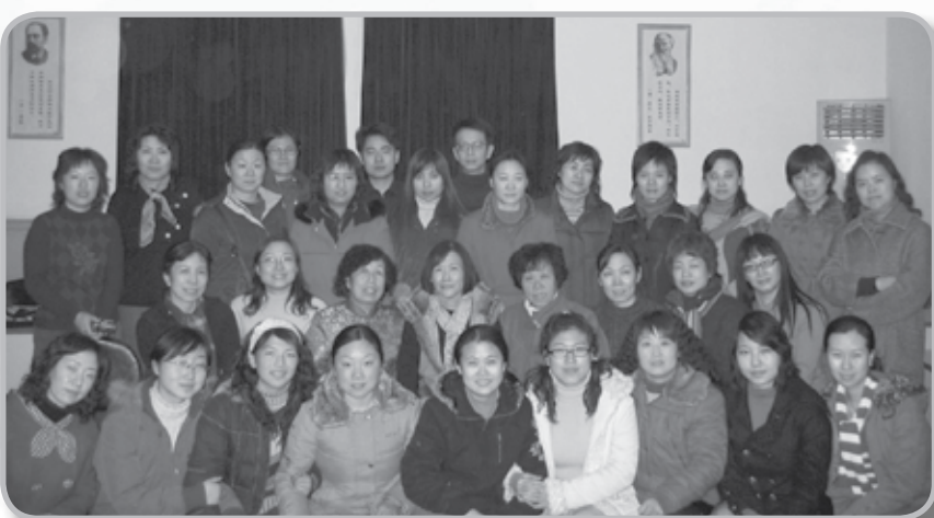
作者(中坐左四) 與30位來上課的教授和老師們。

當40分鐘短片結束後，同學們都回來聚集在課室內。我詢問他們的觀後感，很多人都覺得不可思議，很是感動和震撼。跟著，我勇敢地告訴他們，自己也是一個癌症康復者。他們聽後，不禁嘩然，大吃一驚！因為他們都不敢相信，站在面前的老師和他們相處一個月，看來很健康，又活力充沛，竟然是患過絕症、曾被病痛煎熬的人？對他們而言，是驚訝、是同情；也有不知所措，啞口無言。